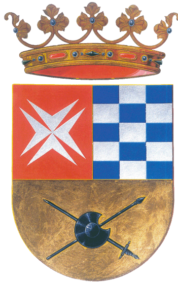
Concejalía de Educación Ayuntamiento Argamasilla de Alba